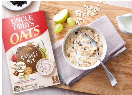
Uncle Tobys, la marca de avena líder en Australia, lanzó Nature's Mix , una gama sin azúcares añadidos que se endulza de forma natural con fruta deshidratada y frutos secos.

Inspirados por nuestro fundador, Henri Nestlé, y con la nutrición como base, colaboramos con terceros para ofrecer alimentos y bebidas que posibiliten una vida más saludable y más feliz. Hemos fijado compromisos y objetivos para que nuestros productos sean aún más saludables y sabrosos, para animar a los consumidores a adoptar estilos de vida más saludables y para desarrollar y compartir nuestros conocimientos sobre la relación existente entre nutrición y salud.