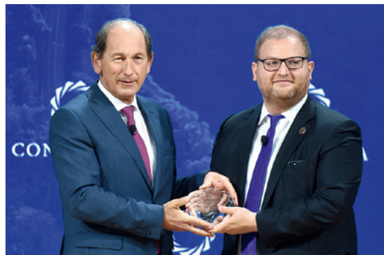
Nueva York, 18 de septiembre de 2017: El Presidente de Nestlé, Paul Bulcke, recibe el Premio al Liderazgo 2017 de la ONG Concordia por impulsar el compromiso constante de la empresa con la Creación de Valor Compartido y por apoyar los Objetivos de Desarrollo Sostenible (ODS) de la ONU.

Involucrar a terceros en temas importantes es la base de nuestra forma de hacer negocios. Recurrimos al