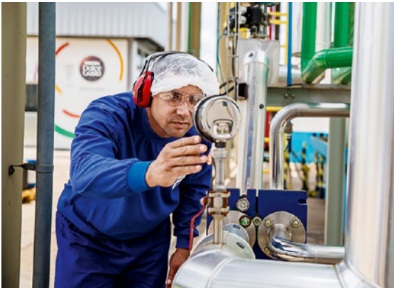
Nuestra fábrica Nescafé Dolce Gusto de Montes Claros (Brasil) logró un triple hito: «cero agua», «cero residuos» a vertedero y «cero emisiones de GEI».